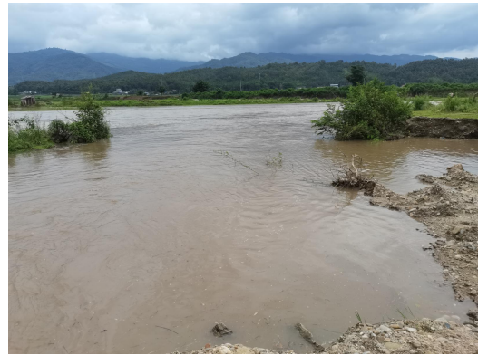
1#支流芒棒河与南宛河汇入口（芒棒河治理终点）