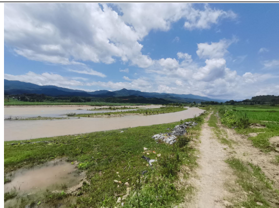
2#支流章碧河与南宛河汇入口（章碧河治理终点）