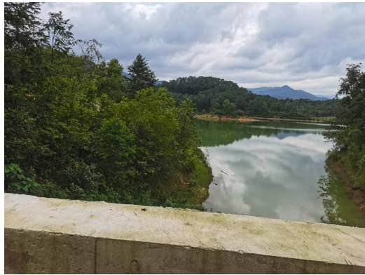
1#支流芒棒河治理起点