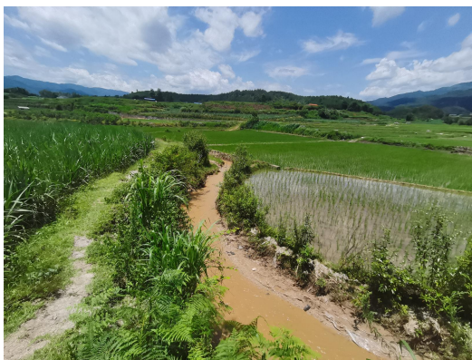
2#支流章碧河治理起点