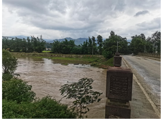
干流南宛河治理终点