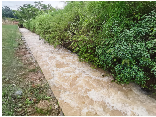
干流南宛河治理起点