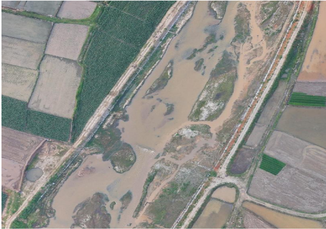
照片 3-1 南宛河河心洲（滩）