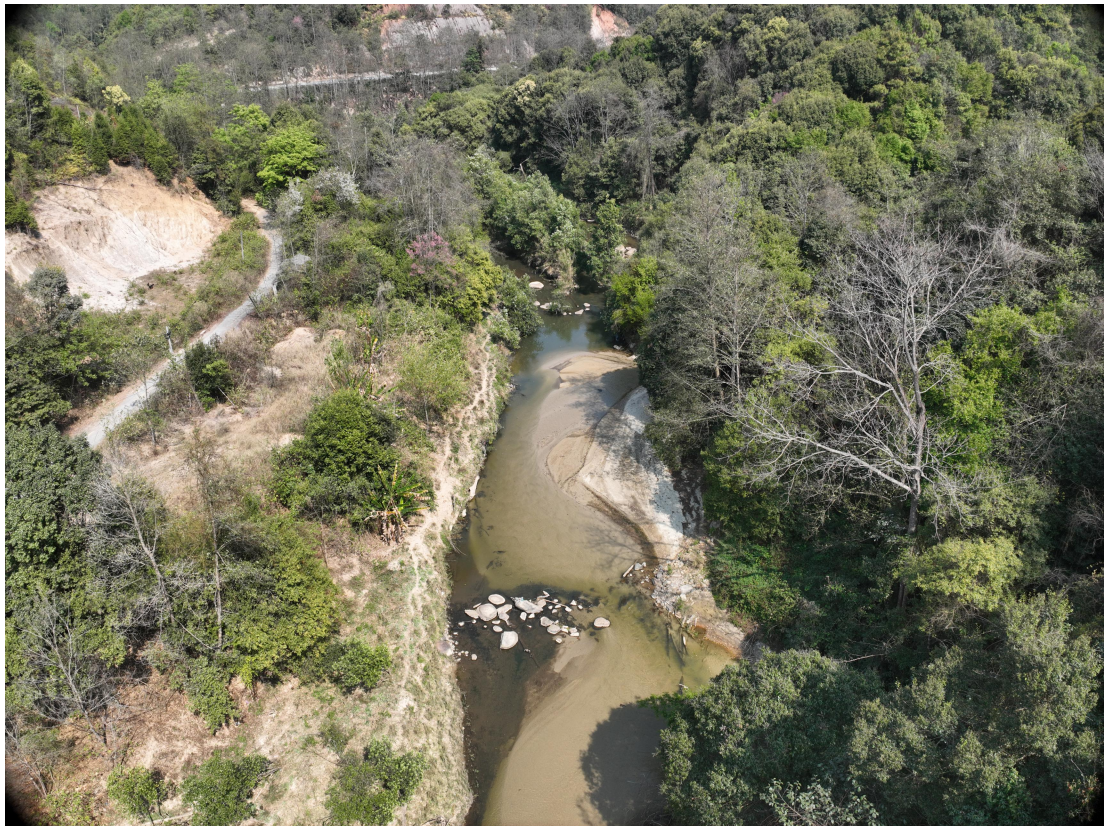
照片 2-4 户撒河沉积的砂石