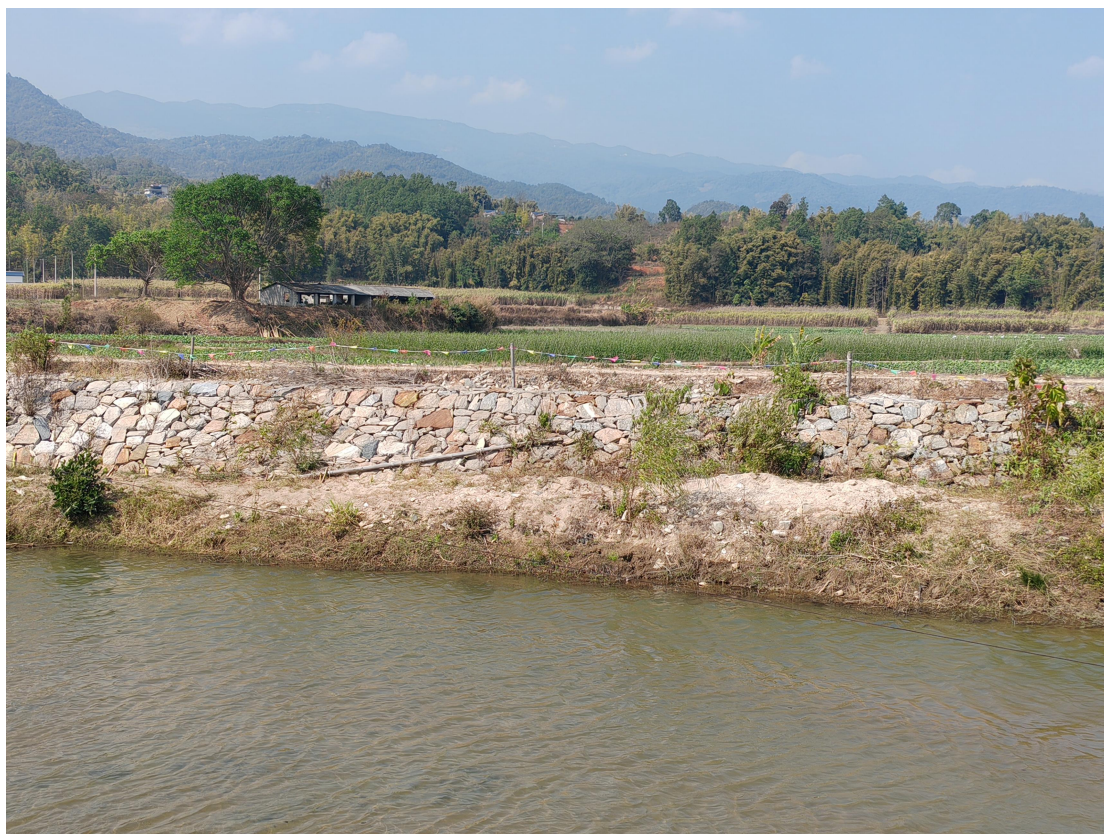
照片 3-2 南宛河堤防工程临水侧边滩

南洼河起点（入境断面）至弄相村民小组段为无堤防、管理要求较低的山区河道。弄相村民小组至国防路桥段为有堤防且达防洪标准、管理要求较高的山区河道，2019年9月至2020年3月，开展了南洼河垒良至龙安段治理工程，概算总投资6619.31万元，治理河道长度11.81km。设计防洪标准10年一遇。工程共布置钢筋石笼护岸工程12700m。；国防路桥至与南宛河交汇口处为无堤防、管理要求较高的坝区河道。因上游为花岗岩地区，且水土流失较严重，坝区段河道比降较小，容易造成河床淤积。即南洼河坝区段河道近期演变以淤积为主。