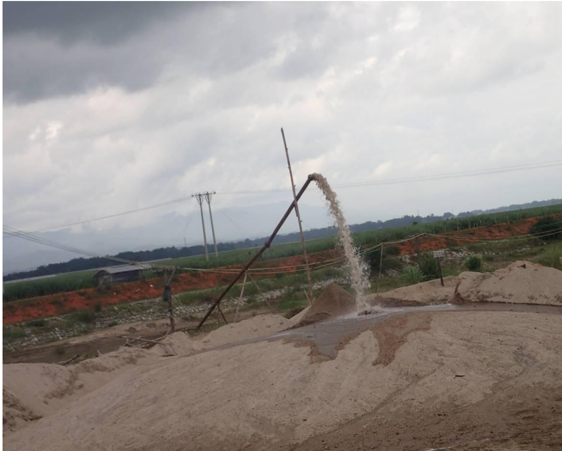
照片 6-5 河道抽砂作业方式

根据各可采区河道特点（河道宽度、砂石厚度、水流大小、来水来砂情况、砂质等），初步建议南洼河（KC-01）、南宛河（KC-02）、户撒河（KC-03）、萝卜坝河（KC-04）规划河段由于河道较长且地形复杂建议施工方使用抽砂机、小型挖掘机、装载机等机械设备根据实地现状进行混合开采（挖掘式开采（简称挖采）或使用抽砂机抽采）。本规划建议的开采方式仅为初步推荐，在更细化的年度开采设计方案中，应加深工作程度，进行更具体的开采设计。