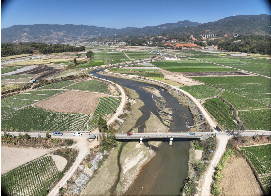
照片 2-3 南宛河沉积的砂石