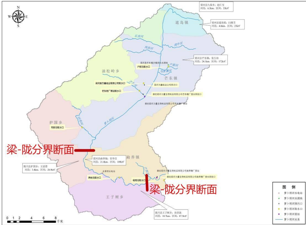
图 6-1 萝卜坝河陇川段示意图