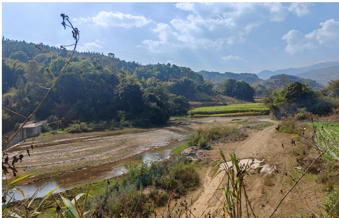
照片 6-2 KC-02 南宛河芒来桥上游河道

KC-02 以南宛河芒来桥为基准点，开采起始断面为护国河与南宛河交汇口，终止断面位于芒来桥上游 500m 处。河段属南宛河山区向坝区的过渡地段，洪水挟持的大量砂石因坡降变缓沉积在河道内，致使河床变浅，洪水泛滥，威胁两岸农田。河道砂石中砾石、卵石较多，如照片 6-2 所示。适量开采河道砂石，可清淤疏浚，加深河床，增强河道行洪能力，并且可减少麻栗坝水库入库泥砂，减轻水库淤积。可采区河段长 3840m，河道平均宽 20m。经估算，规划期（2026—2030 年）可开采砂石总量约 34.95 万 m 3 ；年控制采砂量 6.99 万 m 3 。