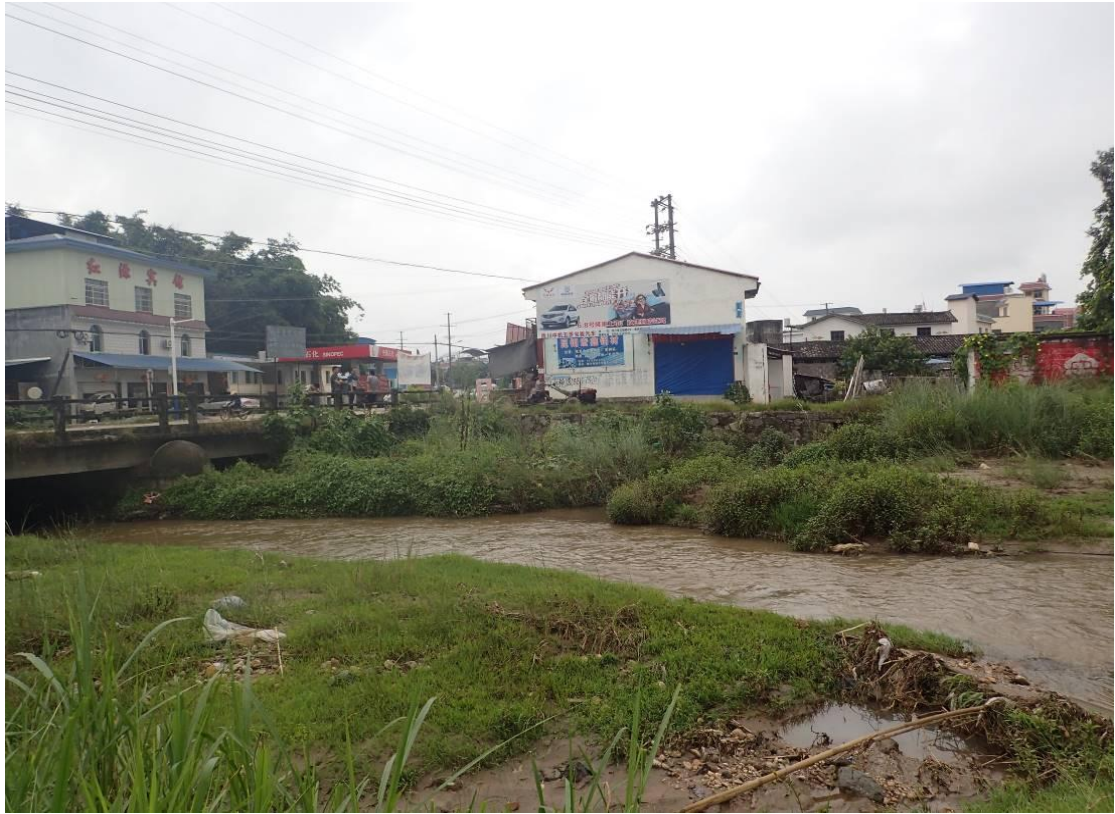
照片 6-6 南撒河泥砂淤积