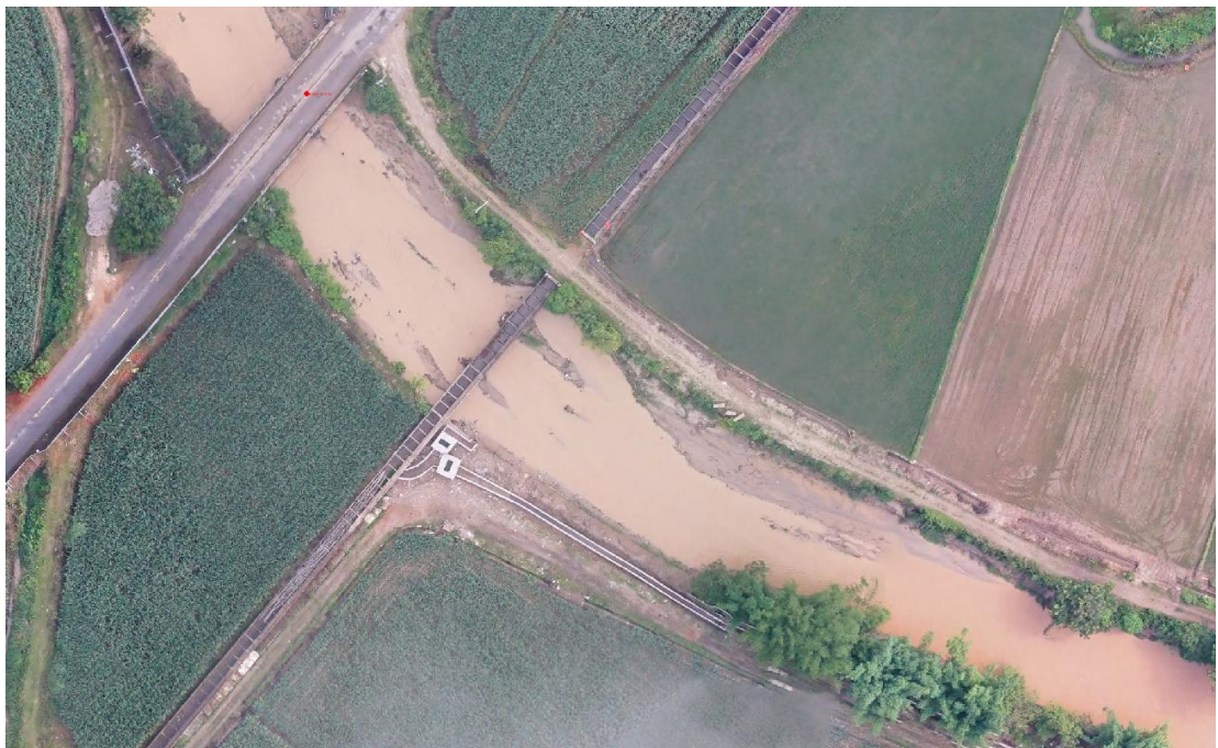
照片 2-2 南洼河沉积的砂石