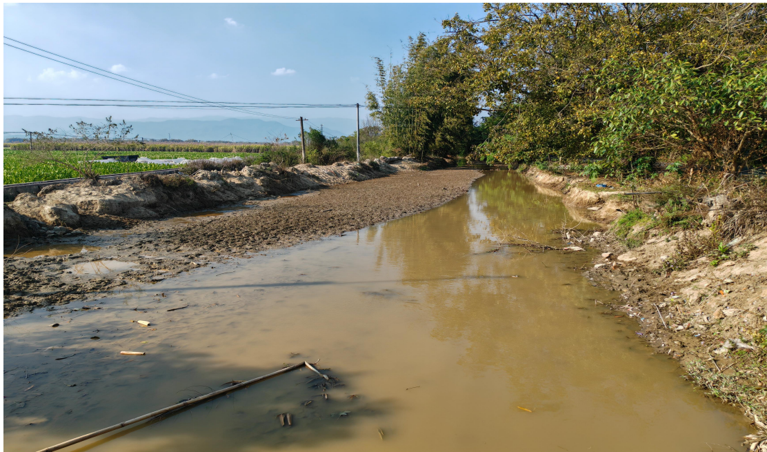
照片 6-1 KC-01 南洼河砂石淤积

以拉线-南多公路跨南洼河桥梁（俗称国防路桥）为基准点，开采起始断面位于国防路桥下游 1.00km 处，终止断面位于南洼河流出弄秀村处。天然河道，淤积较严重，河砂沉积较多（照片 6-1）。因河道淤积导致河床较浅，雨季经常发生洪水漫堤现象，威胁两岸农田。适量开采可清淤疏浚，减轻水患。可采区河段长 4740m，河道平均宽 15m。经估算，规划期（2026—2030 年）可开采砂石总量约 23.75 万 m 3 ；年控制采砂量 4.75 万 m 3 。