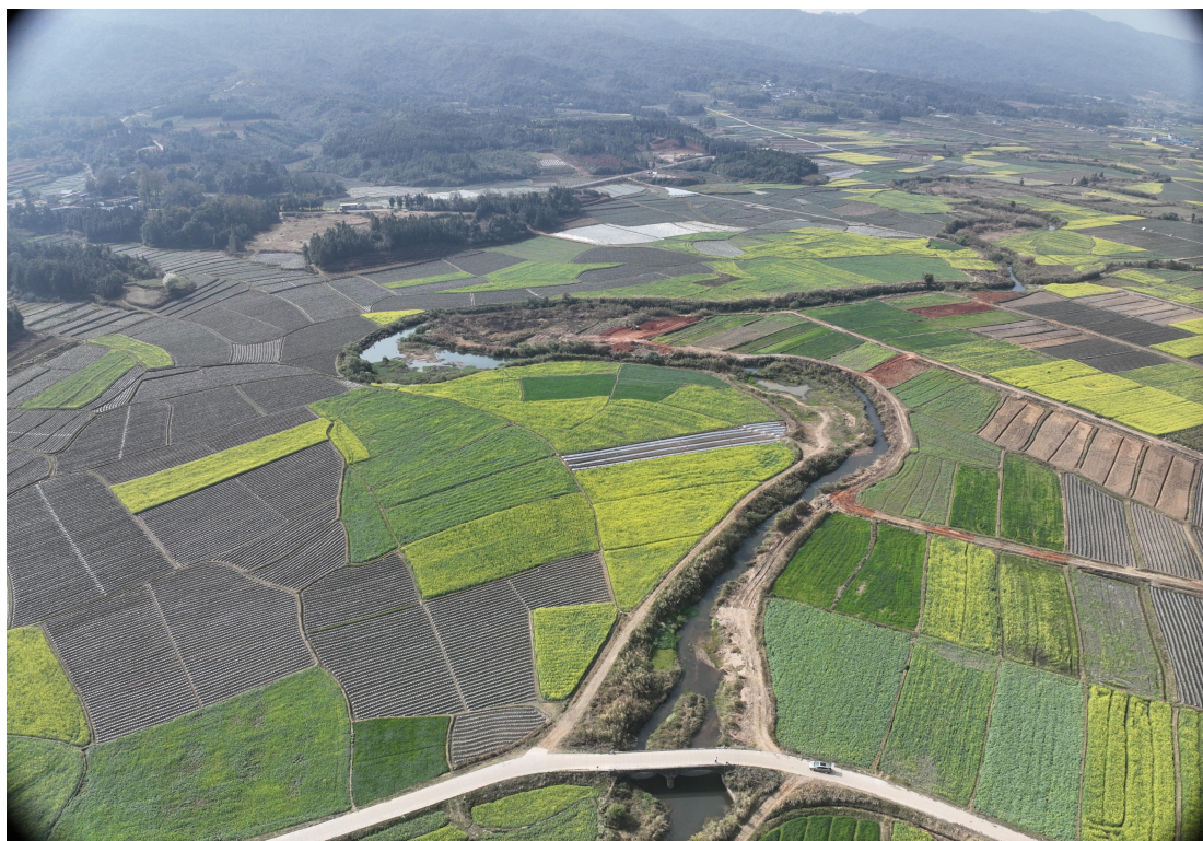
照片 6-3 KC-03 户撒河曼岗桥～户撒乡正丰硅厂之间河道

KC-03 以户撒河曼岗桥为基准点，开采起始断面位于曼岗桥，终止断面位于户撒乡正丰硅厂对面河道。河段属户撒河坝区段，河道蜿蜒曲折，形似牛轭湖。径流区为花岗岩地区，雨季洪水泥砂含量较大，洪水挟持的大量泥砂因坡降变缓、河道弯曲沉积在河道内，致使河床变浅，洪水泛滥，威胁两岸农田，如照片 6-3 所示。适量开采河道砂石，可清淤疏浚，加深河床，增强河道行洪能力，减轻河道淤积。可采区河段长 7286m，河道平均宽 15m。经估算，规划期（2026—2030 年）可开采砂石总量约 28.15 万 m 3 ；年控制采砂量 5.63 万 m 3 。