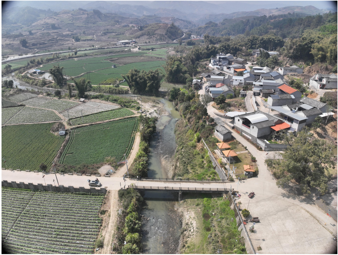
照片 2-5 萝卜坝河沉积的砂石