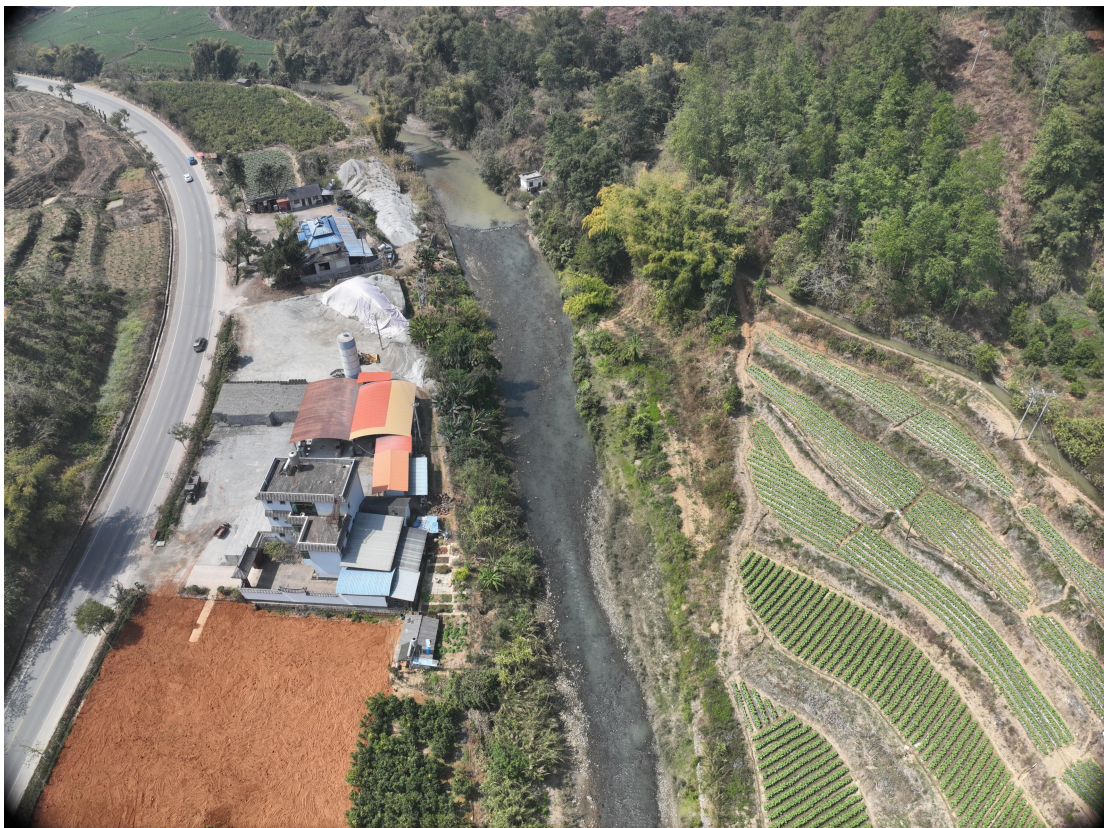
照片 6-4 KC-04 萝卜坝河硝塘桥~盖岭桥之间采砂河段