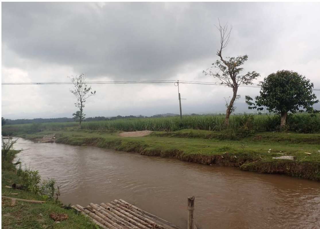
照片 6-7 近引河泥砂淤积