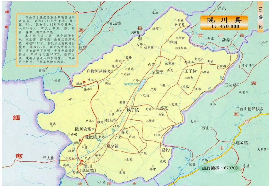
图 2-1 陇川县区位示意图