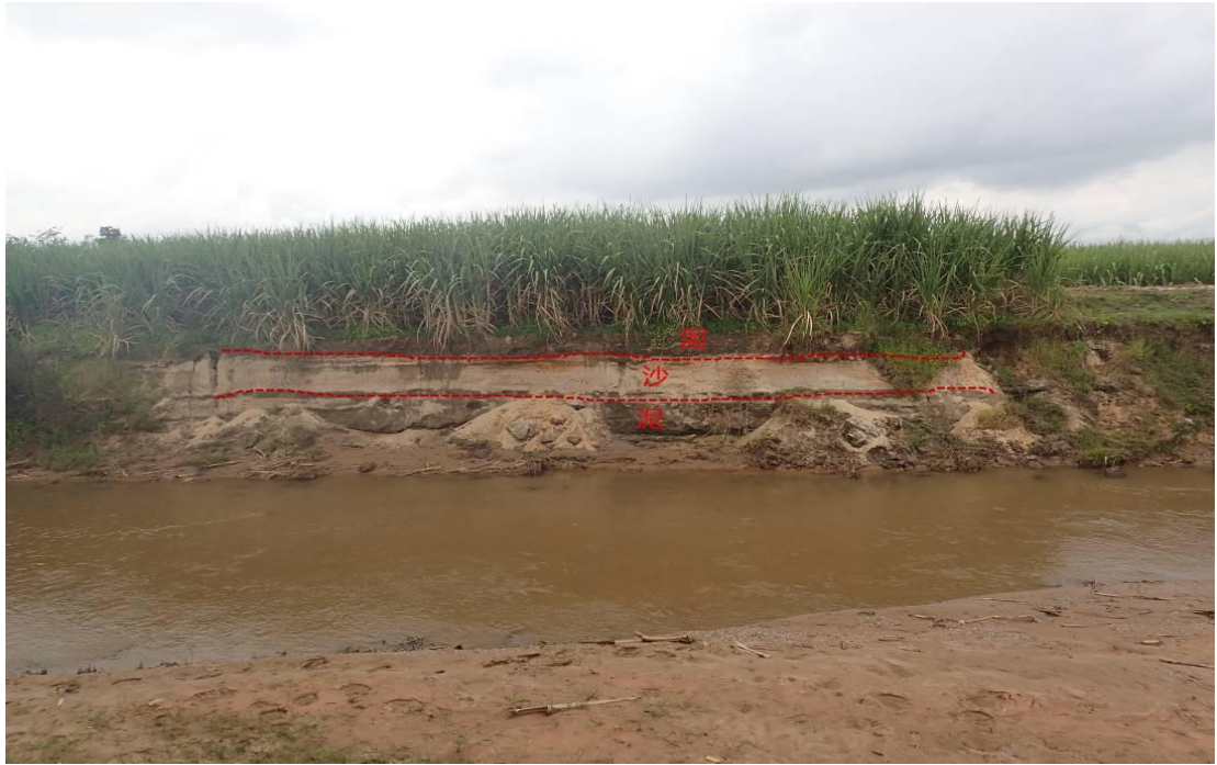
照片 2-1 南宛河边滩沉积的泥-砂二元结构